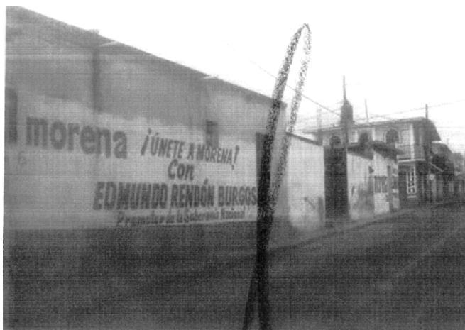
“FOTOGRAFÍA # 4 : UBICADA ENTRE LAS CALLES 5 NORTE Y ADOLFO LÓPEZ MATEOS SOBRE LA CARRETERA FEDERAL HUAMANTLA-PUEBLA, MUNICIPIO DE ZITLALTEPEC DE TRINIDAD SÁNCHEZ SANTOS, TLAXCALA.”