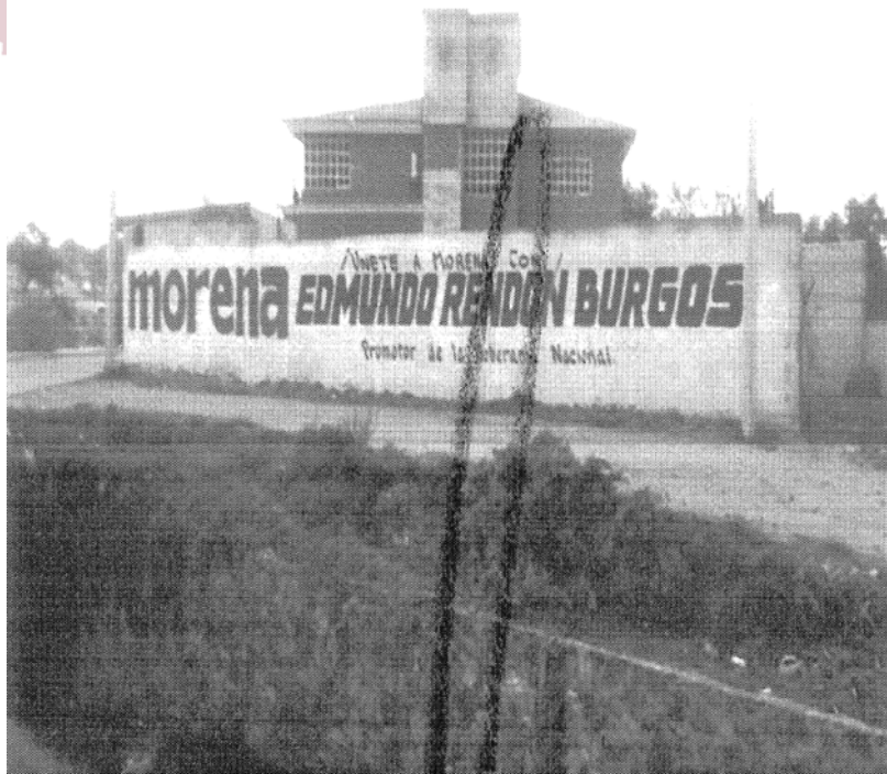
“FOTOGRAFÍA # 8: UBICADA ENTRE LAS CALLES 12 PONIENTE Y PROLONGACIÓN 13 NORTE, MUNICIPIO DE ZITLALTEPEC DE TRINIDAD SÁNCHEZ SANTOS, TLAXCALA.”