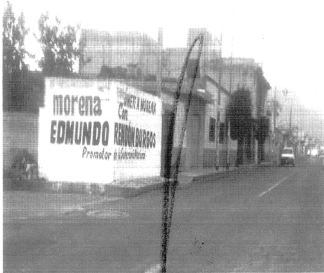
“FOTOGRAFÍA # 3 : UBICADA ENTRE LAS CALLES 5 NORTE Y 12 PONIENTE, SOBRE LA CARRETERA FEDERAL HUAMANTLA-PUEBLA, MUNICIPIO DE ZITLALTEPEC DE TRINIDAD SÁNCHEZ SANTOS, TLAXCALA.”

PROCEDIMIENTO ESPECIAL SANCIONADOR EXPEDIENTE: TET-PES-054/2016