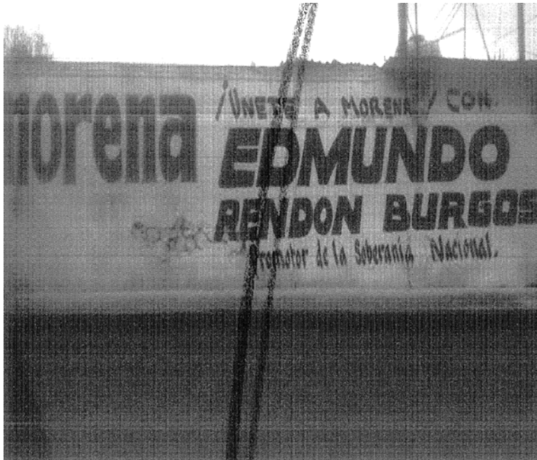
“FOTOGRAFÍA # 9: UBICADA ENTRE LAS CALLES 5 NORTE Y 3 PONIENTE, ENFRENTA DE LA CLÍNICA MUNICIPAL SOBRE LA CARRETERA FEDERAL HUMANTLA-PUEBLA, MUNICIPIO DE ZITLALTEPEC DE TRINIDAD SÁNCHEZ SANTOS, TLAXCALA.”