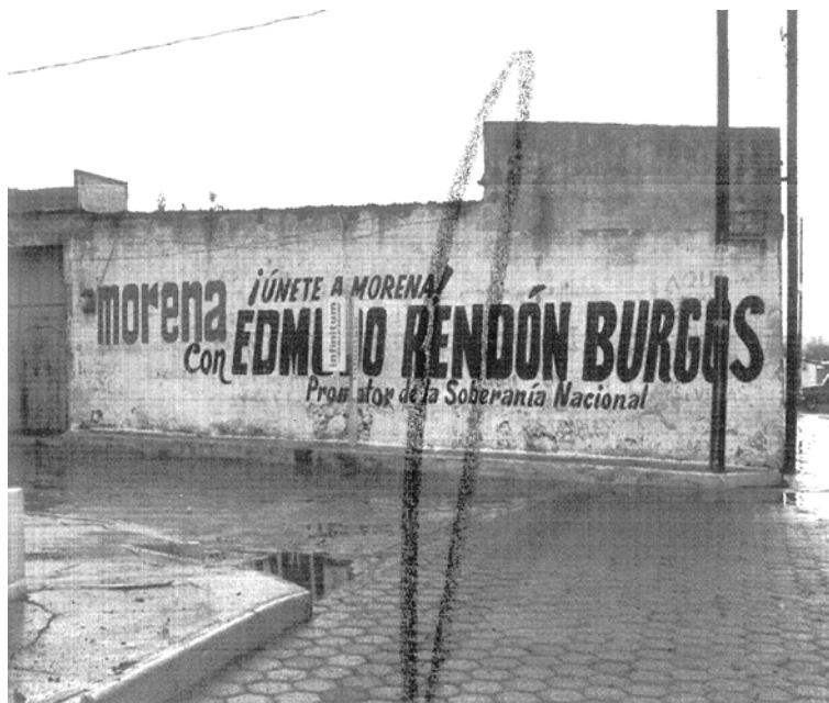
“FOTOGRAFÍA # 6: UBICADA ENTRE LAS CALLES 9 NORTE Y AVENIDA MARTÍN PÉREZ, BARRIO DE GUADALUPE, MUNICIPIO DE ZITLALTEPEC DE TRINIDAD SÁNCHEZ SANTOS, TLAXCALA.”