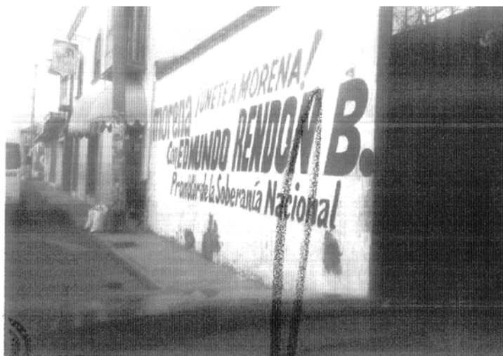
“FOTOGRAFÍA # 1: UBICADA ENTRE LAS CALLES 5 NORTE Y 10 PONIENTE, CARRETERA HUAMANTLA-TLAXCALA, MUNICIPIO DE ZITLALTEPEC DE TRINIDAD SÁNCHEZ SANTOS, TLAXCALA.”

Bardas pintadas, cuyo contenido se aprecia en las siguientes imágenes 1 :