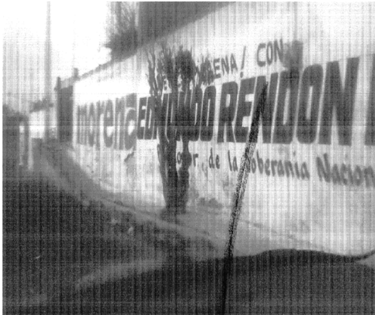
“FOTOGRAFÍA # 5: UBICADA ENTRE LAS CALLES 5 NORTE Y 5 PONIENTE, SOBRE LA CARRETERA FEDERAL HUAMANTLA-PUEBLA, MUNICIPIO DE ZITLALTEPEC DE TRINIDAD SÁNCHEZ SANTOS, TLAXCALA.”