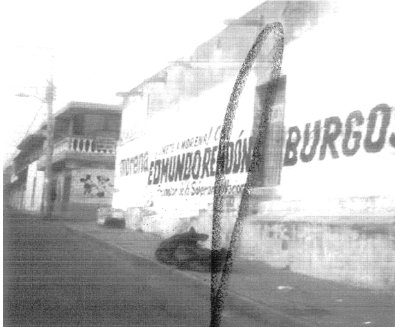
“FOTOGRAFÍA # 7: UBICADA ENTRE LAS CALLES 5 NORTE Y ADOLFO LÓPEZ MATEOS SOBRE LA CARRETERA FEDERAL HUAMANTLA-PUEBLA, MUNICIPIO DE ZITLALTEPEC DE TRINIDAD SÁNCHEZ SANTOS, TLAXCALA.”

PROCEDIMIENTO ESPECIAL SANCIONADOR EXPEDIENTE: TET-PES-054/2016