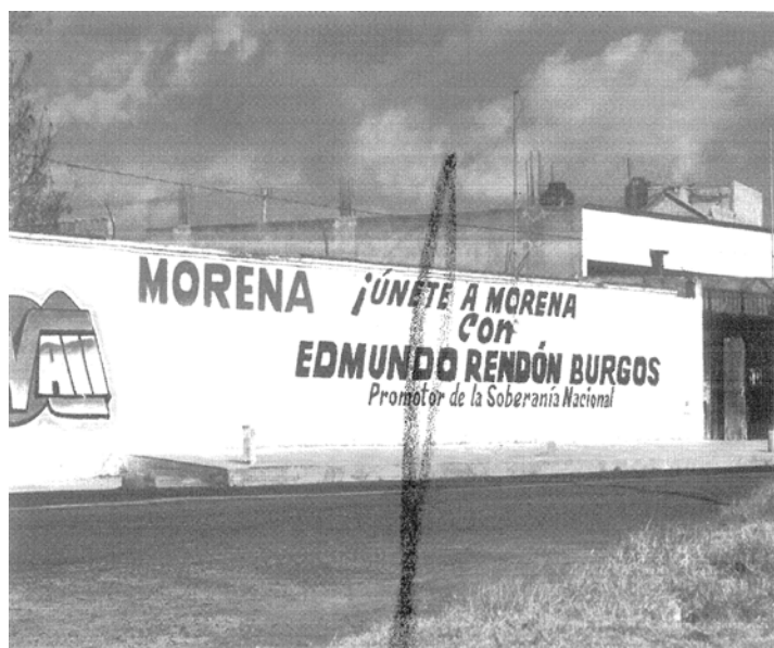
“FOTOGRAFÍA # 2 : UBICADA ENTRE LAS CALLES 5 NORTE Y 16 PONIENTE, CARRETERA FEDERAL HUAMANTLA-TLAXCALA, MUNICIPIO DE ZITLALTEPEC DE TRINIDAD SÁNCHEZ SANTOS, TLAXCALA.”