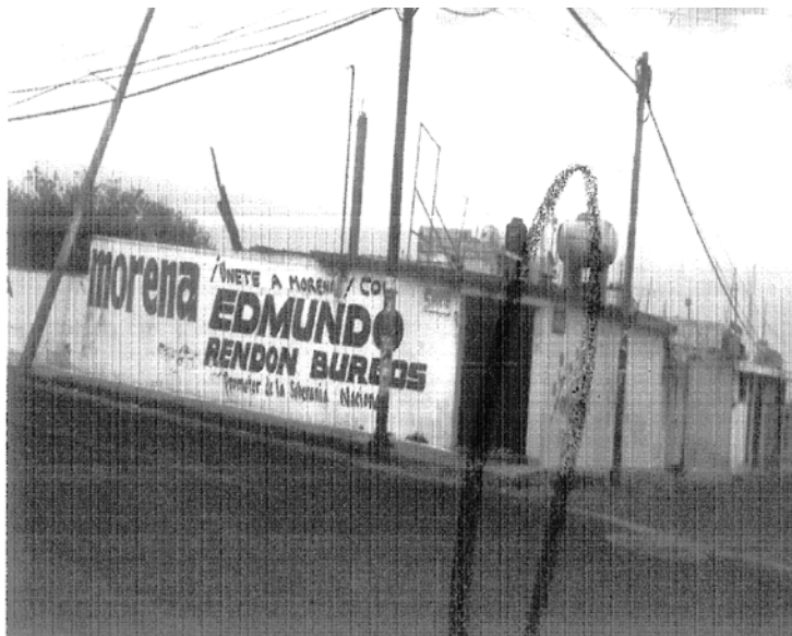
“FOTOGRAFÍA # 10: UBICADA ENTRE LAS CALLES 5 NORTE Y 12 PONIENTE, SOBRE LA CARRETERA FEDERAL HUMANTLA-PUEBLA, MUNICIPIO DE ZITLALTEPEC DE TRINIDAD SÁNCHEZ SANTOS, TLAXCALA.”