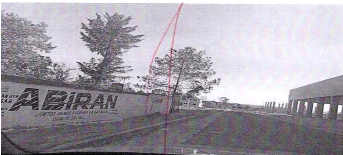
Ubicación: A un costado del auditorio en construcción, sobre la calle Niños Héroes, esquina con calle Reforma.