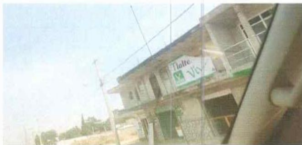
LONA 12 CALLE MALINTZI ENTRE CALLE CUAUHTEMOC Y 29 DE SEPTIEMBRE