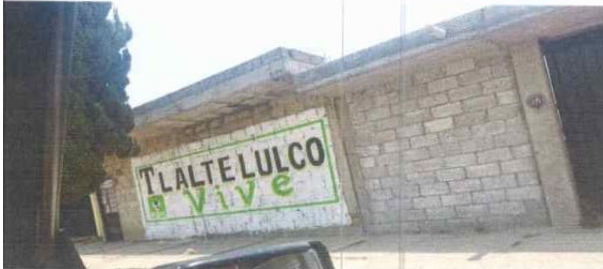
BARDA 11 CALLE PROGRESO ENTRE 16 DE SEPTIMBRE