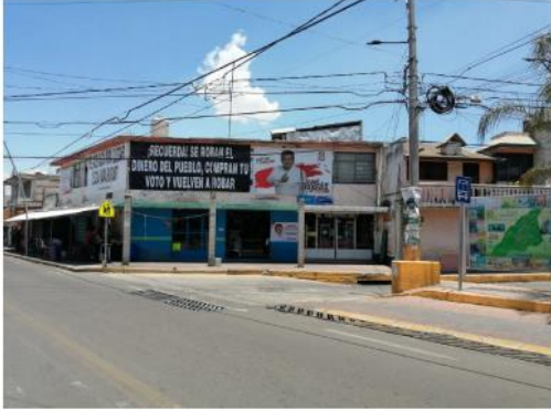
Imagen 1: Se observa una lona con fondo blanco, del lado superior izquierdo en letras negras y rojas respectivamente, el texto “LISTOS para CREAR”, en la parte central una persona del sexo masculino, tez morena, cabello negro, utilizando una camisa blanca; del lado superior derecho el logo del Partido Redes Sociales Progresistas; en la parte inferior derecha en letras negras y rojas respectivamente Josué GUZMAN ZAMORA.